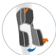
Incorpora dediles en la parte anterior.