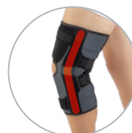
Articulaciones policéntricas de aluminio